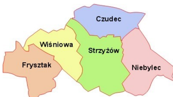
Rys. 1 Gmina Niebylec na tle powiatu strzyżowskiego