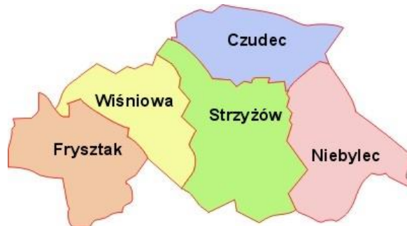
Rys. 1 Gmina Niebylec na tle powiatu strzyżowskiego